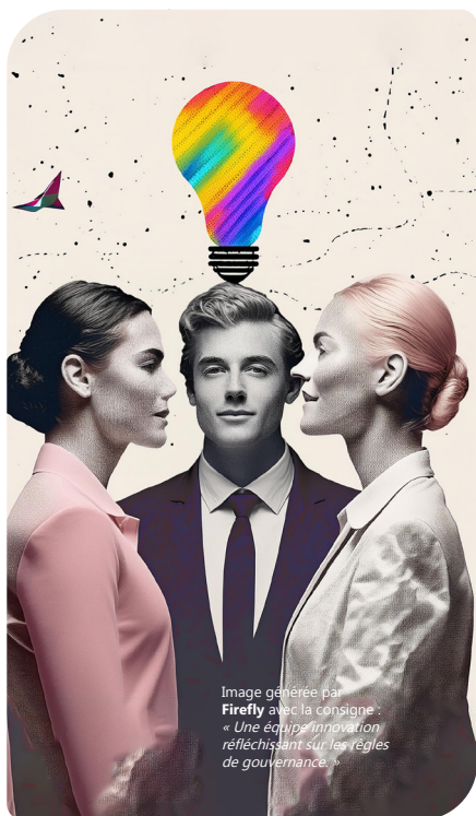
Image générée par Firefly avec la consigne : « Une équipe d'innovation réfléchissant sur les règles de gouvernance. »

Ces activités doivent être menées à la fois au niveau de la politique générale d'IA de l'organisation et pour chaque système développé. Une évaluation rigoureuse de ces risques permet de mettre en place des mesures d'atténuation appropriées et de maximiser les opportunités offertes par l'IA. Cela aide également à garantir la conformité réglementaire pour chaque système. Les processus de décision doivent être transparents et impliquer diverses parties prenantes pour s'assurer que toutes les perspectives sont prises en compte. De plus, cette évaluation doit être réalisée régulièrement pour s'assurer que les conclusions restent actuelles à mesure que les systèmes évoluent.