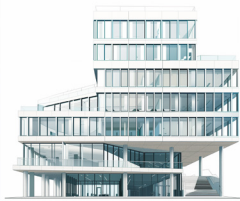
Image générée par Midjourney avec la consigne : « Illustration of a european administration building or office, white background in the style of Malika Favre, Noma Bar, white background --v 6.0 »

À l'échelle internationale, les approches réglementaires varient. Aux États-Unis, la régulation de l'IA est moins centralisée, avec des initiatives principalement menées par des agences sectorielles comme la Federal Trade Commission (FTC) et la Food and Drug Administration (FDA). Cependant, il existe une prise de conscience croissante de la nécessité d'un cadre réglementaire plus cohérent.