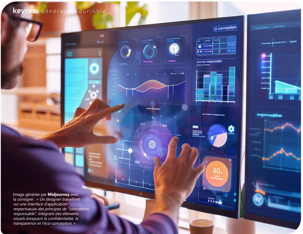
Image générée par Midjourney avec la consigne : « Un designer travaillant sur une interface d'application respectueuse des principes de "conception responsable", intégrant des éléments visuels évoquant la confidentialité, la transparence et l'éco-conception. »