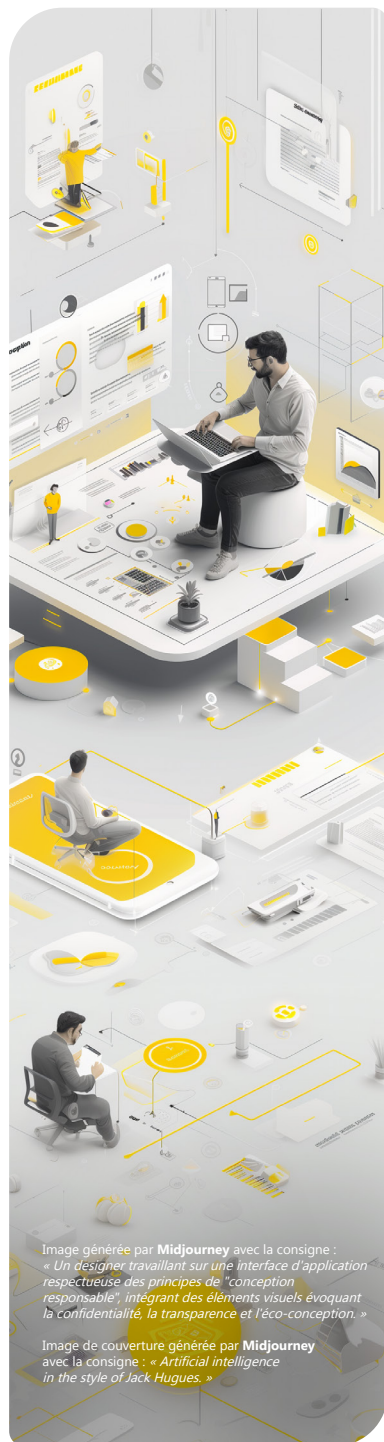
Image générée par Midjourney avec la consigne : « Un designer travaillant sur une interface d'application respectueuse des principes de "conception responsable", intégrant des éléments visuels évoquant la confidentialité, la transparence et l'éco-conception. »