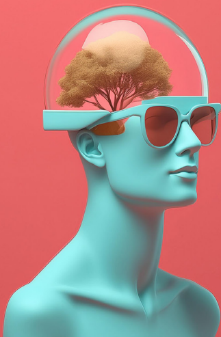
Image générée par Firefly avec la consigne : « Mise en œuvre de pratiques d'éco-conception dans la programmation informatique d'applications innovantes. »